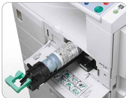
Pełen dostęp z przodu - prosta i łatwa obsługa.

Czy chcesz zredukować koszty związane z obiegiem dokumentów i jednocześnie zwiększyć wydajność? MP 1600L/MP 2000LN to wielofunkcyjne rozwiązanie w jednej, zwartej obudowie, dzięki którym nie tylko usprawnisz pracę ale też sprawisz, że budżet wydatków nie zostanie przekroczony.