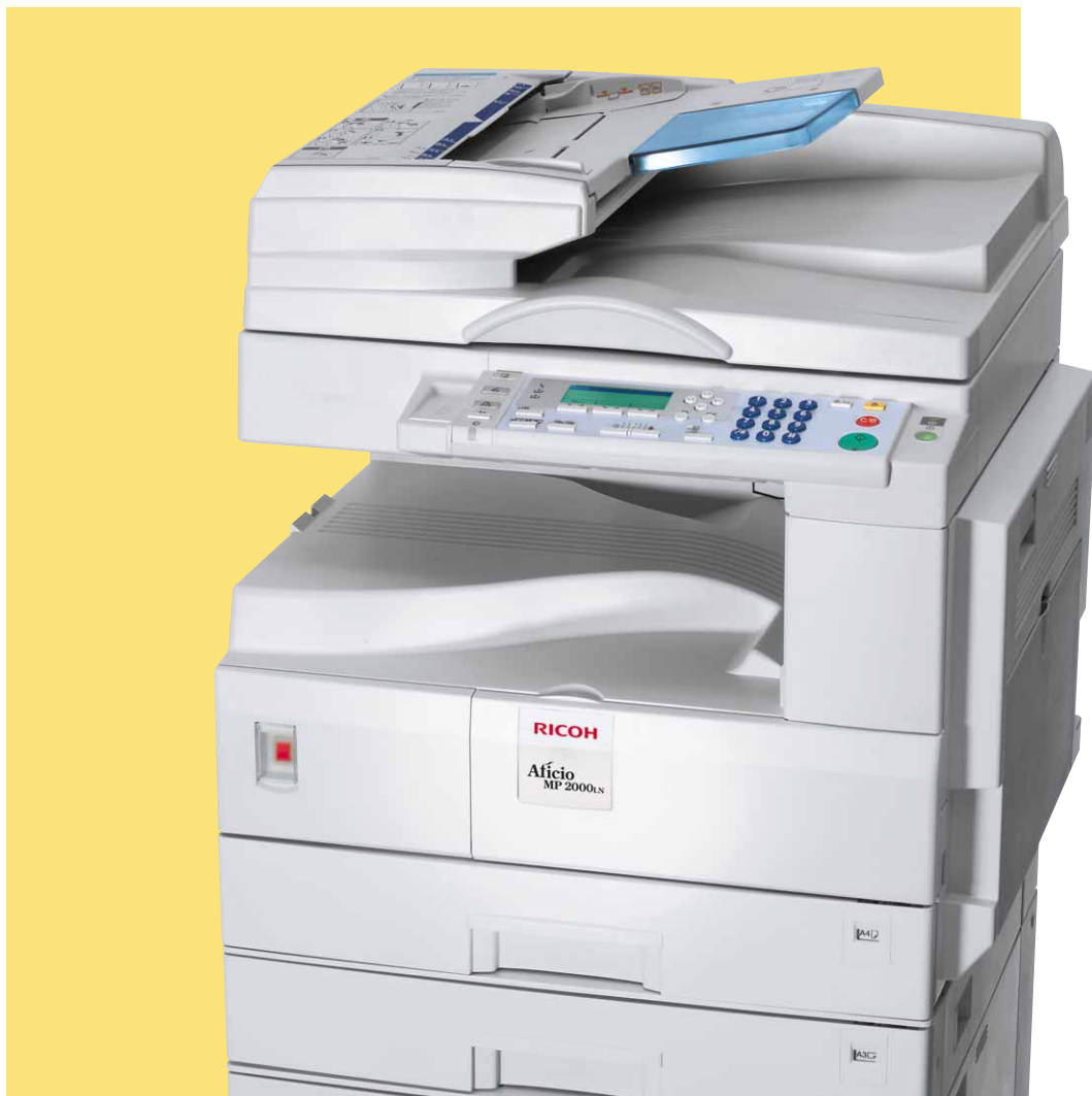
Aficio™ MP 1600L/MP 2000LN

Uniwersalni partnerzy formatu A3 w Twoim biurze