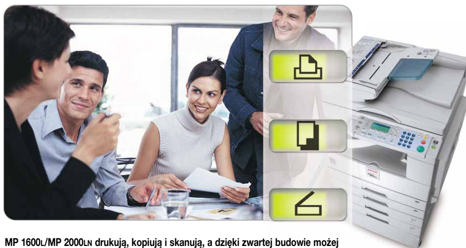
MP 1600L/MP 2000LN drukują, kopiują i skanują, a dzięki zwartej budowie może je postawić gdziekolwiek chcesz.

Popraw wizerunek firmy dzięki doskonale wyglądającym dokumentom. MP 1600L/MP 2000LN zapewnią Ci wysoką jakość, jakiej szukasz. Ponieważ oryginały są skanowane tylko raz i zapisywane w pamięci jako jakość wydruków jest zawsze nieskazitelna. Ostre i wyraźne dokumenty to zawsze gwarancja zrobienia dobrego wrażenia.